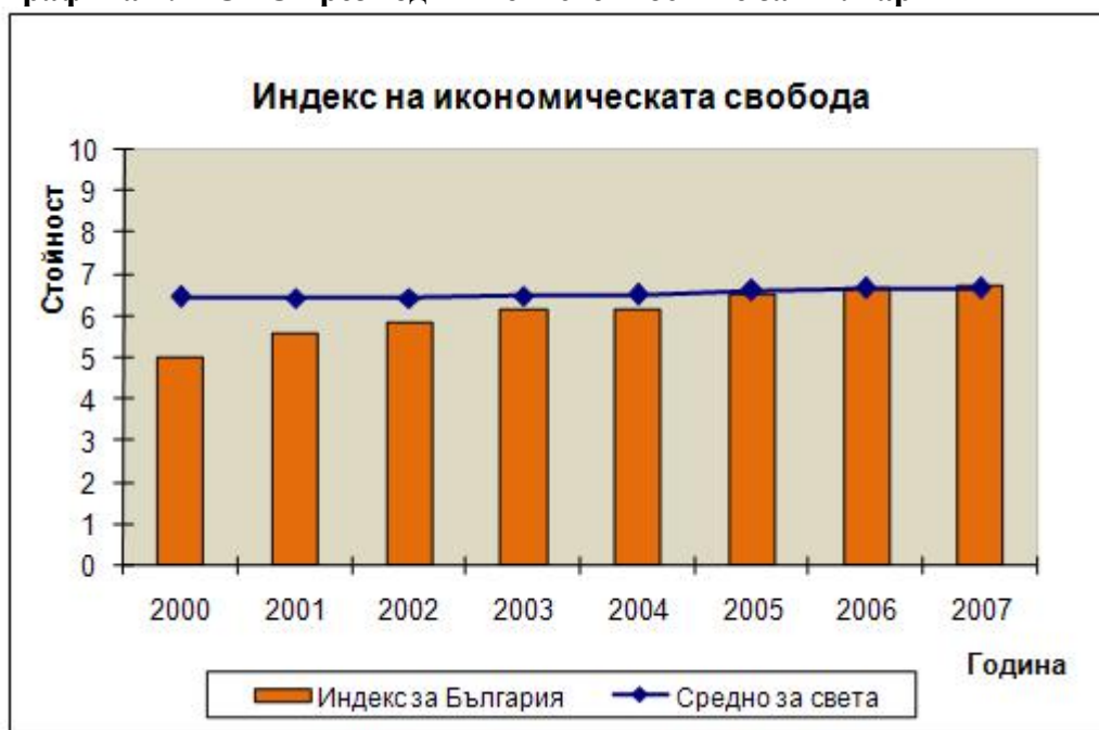
Графика 1: ИСИС през годините и стойностите за България