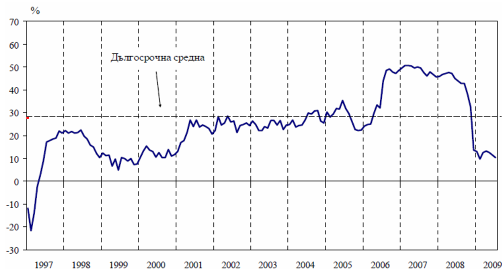
Фиг. 1: Бизнес климат в България